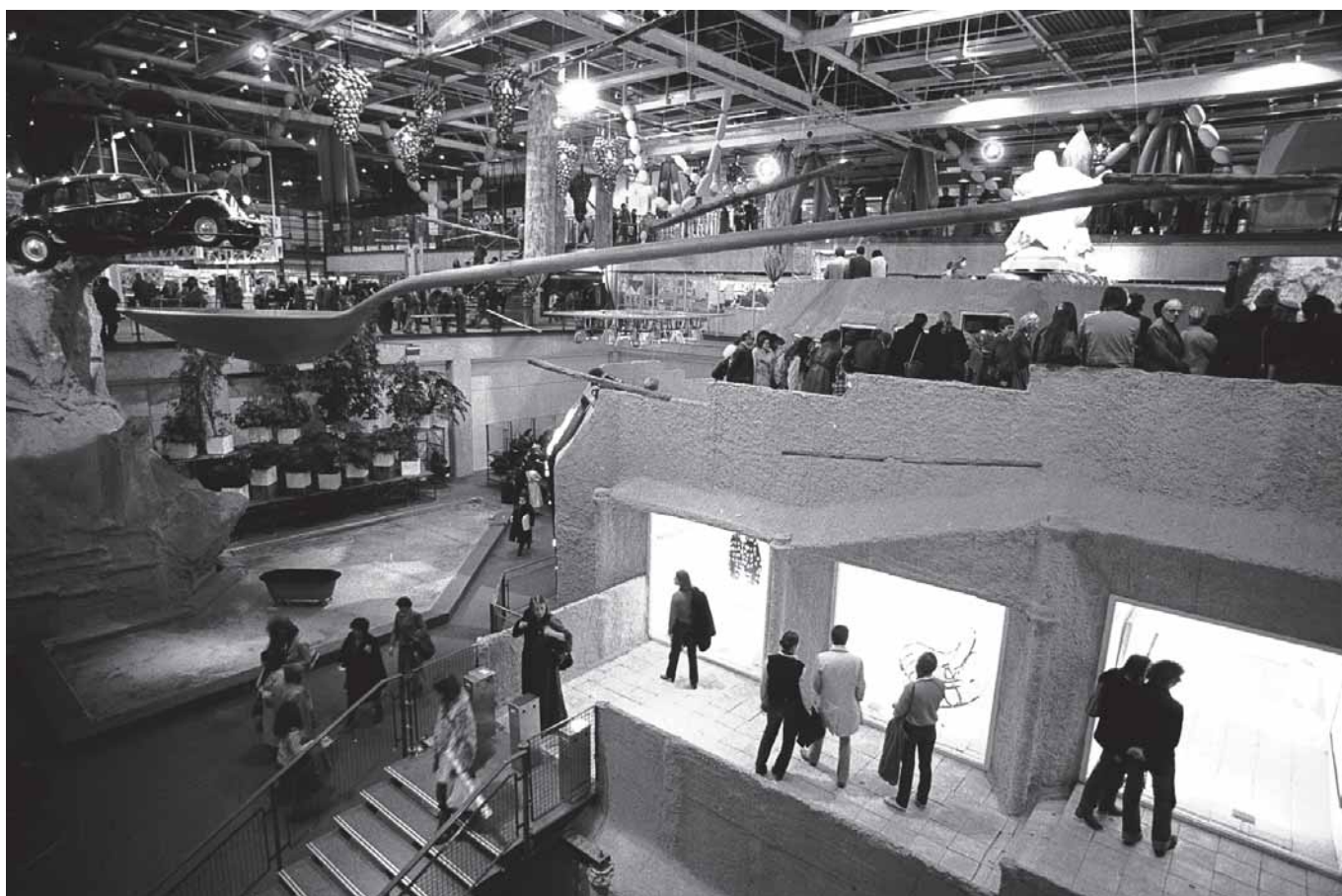
La Kermesse héroïque de Salvador Dalí, Paris, 1979-1980

Le 8 août 2002, un article paru dans le quotidien Sud Ouest rapporte que « la mairie de Bordeaux conserve dans un entrepôt la fameuse cuiller de Salvador Dalí. L'œuvre en tôle de 47 mètres de long avait été prêtée en 1981 par le Centre Pompidou dans le cadre d'une exposition à l'entrepôt Lainé de Bordeaux. Depuis, la cuiller est restée sur les bords de la Garonne, le Centre Pompidou ne semblant pas pressé de la